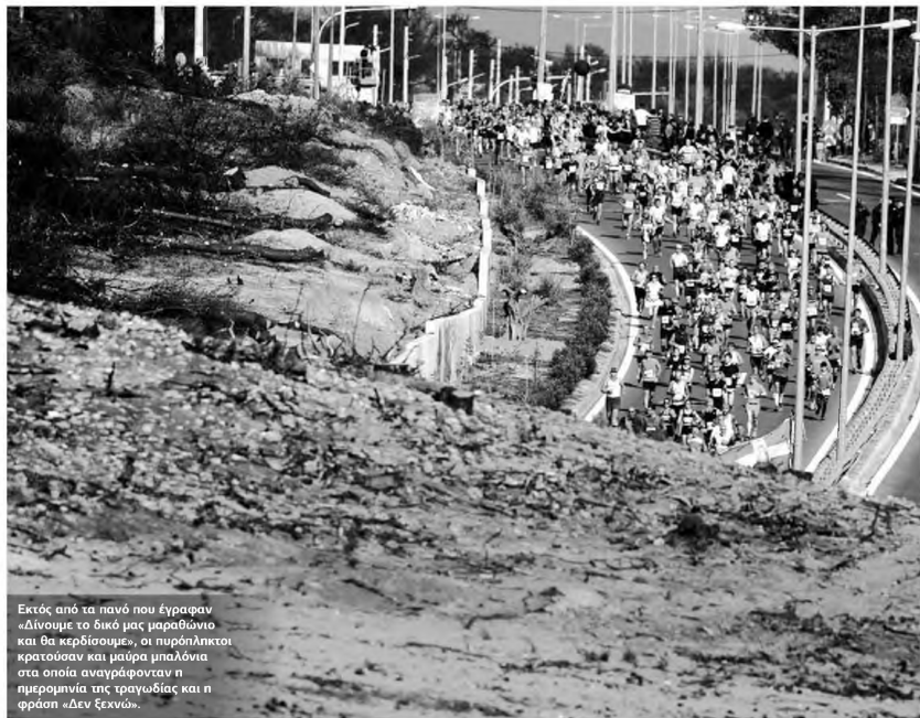
Εκτός από τα πανό που έγραφαν «Δίνουμε το δικό μας μαραθώνιο και θα κερδίσουμε», οι πυρόπληκτοι κρατούσαν και μαύρα μπάλονια στα οποία αναγράφονταν η ημερομηνία της τραγωδίας και η φράση «Δεν ξεχνώ».