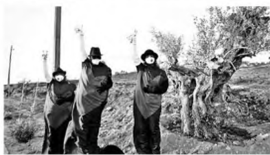
Τρία άτομα με μαύρη φορεσιά με μια μεγάλη κόκκινη καρδιά στο κέντρο, φορούσαν μάσκες και κρατούσαν από ένα κλαδί ελιάς.